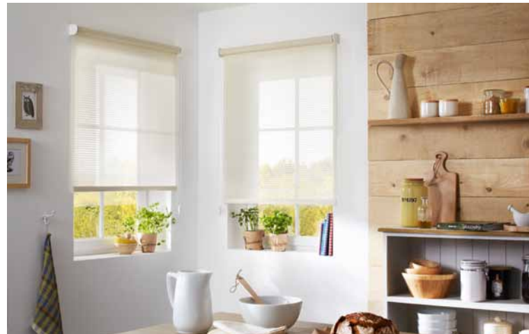
Classic-Rollos mit Trägerprofil | Seite 8