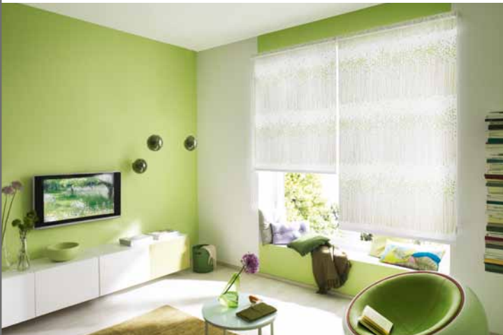
Classic-Rollos | Seite 6

Unser Rollo-Programm gliedern wir in vier Typen. Mit diesen unterschiedlichen Techniken bieten wir die passende Lösung für nahezu alle Anwendungsfälle.