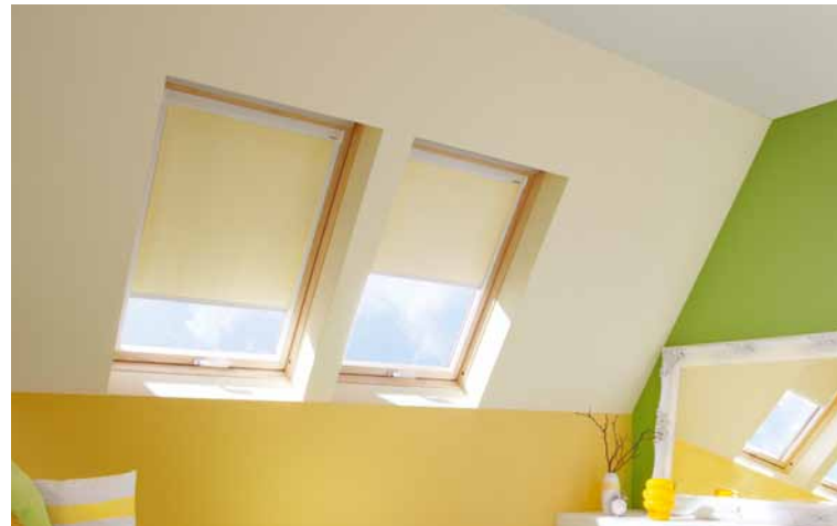
Dachfenster-Rollos | Seite 12