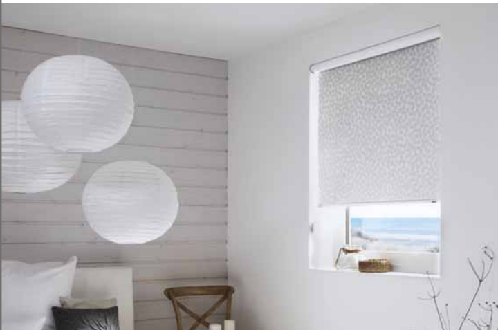
Kassetten-Rollos | Seite 10